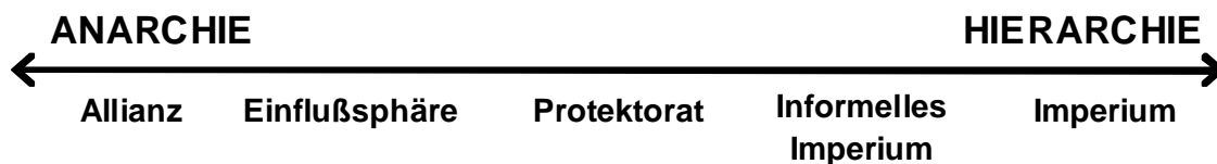
Abbildung 2: Kooperationsstufen 16

In einer kooperativen Sicherheitsbeziehung unterscheidet Lake wiederum ein Kontinuum von Beziehungen zueinander. Dabei ist zwischen Anarchie und Hierarchie jede Abstufung möglich. Anarchie ist nach Lake durch die volle Autorität und Entscheidungsfreiheit jeder Partei gekennzeichnet. In einer Hierarchie hingegen besitzt die dominante Partei die Autorität alle Entscheidungen für die untergeordnete Partei zu treffen. 15 Abbildung 2 zeigt die möglichen Abstufungen der Beziehungen zweier Staaten zueinander.