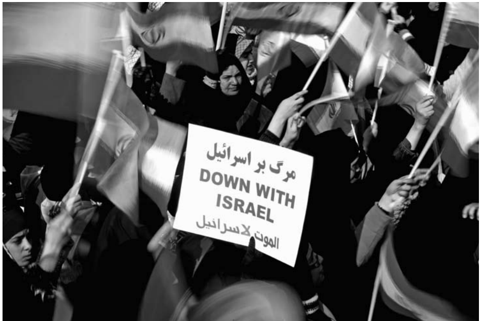
Auf der Feier zum 31. Jahrestag der islamischen Revolution am 11. Februar 2010 verkündete der iranische Präsident Ahmadinejad, dass es in Natanz gelungen sei, erstmalig Uran auf 20 Prozent anzureichern. Stolz auf die wissenschaftliche Leistung, die Aussicht auf bald erreichbare Atomwaffen und anti-israelische Tiraden bilden wie schon so oft eine gefährliche Drohkulisse für Israel.

Der Westen allerdings, allen voran die Obama-Regierung, reagiert merkwürdig verhalten auf diese Drohkulisse und signalisiert Kooperationsbereitschaft. Das ist fatal, bestätigt er doch damit ungewollt Ahmadinejads harten Kurs. Was die Bush-Regierung dem gemäßigten Vorgänger Ahmadinejads Khatami vorenthalten hat, wird dem fanatischen Nachfolger hoffnungsfroh angeboten. Harald Müller stellt im vorliegenden Standpunkt das iranische Atomprogramm vor, beleuchtet die Ideologie Ahmadinejads, lotet seine Machtposition innerhalb des Iran aus und bewertet die Chancen, die Politik des Iran zu beeinflussen. Nach gründlichen Überlegungen warnt er vor der eingeschlagenen Appeasement-Politik, die für Israel und den Weltfrieden fatale Folgen haben könnte. Karin Hammer