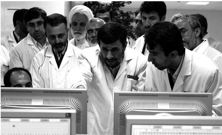
Rein zivile Interessen? Stolz präsentiert sich Ahmadinejad der Presse bei einem Besuch in der Urananreicherungsanlage in Natanz 2008. Experten schätzen, dass es technisch möglich ist, in Natanz innerhalb von sechs Monaten genügend Material für eine Kernwaffe anzureichern.

indirekte Weise passieren können: Wenn Ahmadinejad die Wahl im Frühjahr gegen einen kompromissbereiteren Rivalen verloren hätte.