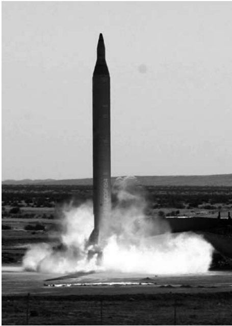
Erneuter Raketentest im Iran Ende September 2009. Die Langstreckenrakete Shabab-3 hat eine Reichweite von 2000 km und ist damit in der Lage, jeden beliebigen Punkt in Israel zu treffen.

na ausreisen zu lassen. 52 Aber Israel wird nicht warten, bis ein von Ahmadinejad oder einem Politiker des gleichen Schlages regierter Iran über genug hoch angereichertes Uran für Kernwaffen verfügt.