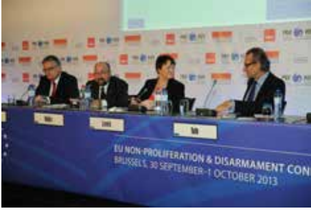
EU Non-Proliferation and Disarmament Conference 2013, www.nonproliferation.eu