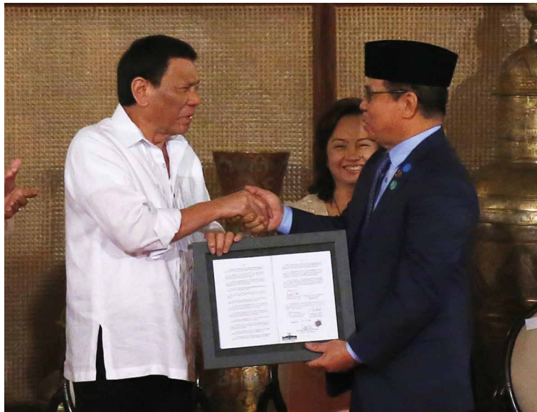
Präsident Rodrigo Duterte und MILF-Anführer Al Haj Murad Ebrahim präsentieren das Bangsamoro Organic Law (Foto: © picture alliance / AP Photo).

Die Aufgaben der Übergangsregierung sind immens. Sie agiert nicht nur als Interimsregierung, sondern ist unter anderem auch verantwortlich für die Schaffung einer parlamentarischen Geschäftsordnung, einer Wahlordnung, Steuerordnung, Abgabenordnung, eines Beamtendienstrechts und einer Gemeindeordnung sowie der Verwaltungsregeln für die zukünftige autonome Zone. Auch wenn hier einige Verzögerungen und Probleme zu erwarten sind, ist es doch in Anbetracht der erlernten