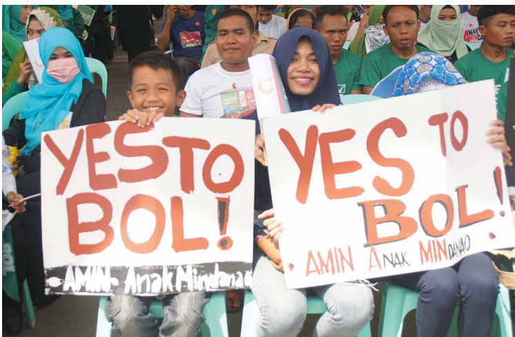
Plakate mit der Aufschrift „Yes to BOL“ zeigen die Zustimmung der Bevölkerung in Cotabato Stadt zum Bangsamoro Organic Law.

Ende Januar ist der Friedensprozess in dem fünf Jahrzehnte währenden bewaffneten Konflikt zwischen muslimischen Rebellen und dem philippinischen Staat einen großen Schritt vorangekommen. Die lokale Bevölkerung stimmte einem Fahrplan und einer Verfassung für eine erweiterte und gestärkte autonome Region im mehrheitlich muslimischen Süden der Philippinen zu. Dieser Erfolg ist ein Ergebnis eines langen Lernprozesses. Unilaterales Handeln wich der Suche nach bilateralem Konsens, Kritiker wurden eingebunden. Vage Formulierungen in Übereinkünften, aus denen neue Konfrontation erwuchs, wichen präzisen Bestimmungen über die zukünftige Ordnung und die Verhandlungen wurden zunehmend widerstandsfähig gegen externe Versuche sie aus der Bahn zu werfen.