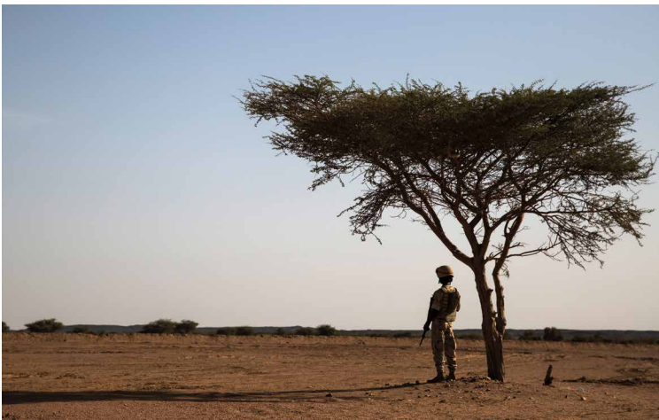
Ein Soldat der MINUSMA Mission der Vereinten Nationen im nördlichen Mali.

Sicherheit im Sahel war das dominierende Thema zahlreicher hochrangiger Konferenzen in den vergangenen Wochen: bei der Verlängerung des Mandats der UN-Blauhelm-Mission in Mali durch den UN-Sicherheitsrat, beim Gipfel der Afrikanischen Union in Mauretanien sowie beim EU-Ministerratstreffen in Brüssel zum EU-Engagement im Sahel Ende Juni 2018. Auch der jüngste Besuch von Kanzlerin Merkel in Westafrika zeigt, wie sehr die Region in den Fokus Europas und europäischer Sicherheitsinteressen gerückt ist. Seit Ende 2017 ist dort ein weiterer militärischer Akteur im Einsatz: die G5 Sahel Joint Force, eine von fünf Sahelländern initiierte Einsatztruppe. Ob diese zu mehr Sicherheit in der Region beitragen wird, bleibt fraglich.