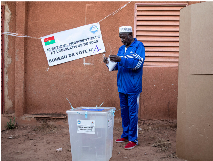
Trotz der desolaten Sicherheitslage und zahlreicher Hindernisse konnten die Wahlen in Burkina Faso am 22. November wie geplant stattfinden.

Am 22. November 2020 wurde in Burkina Faso gewählt. Den vorläufigen Ergebnissen zufolge ist der amtierende Präsident Roch Marc Christian Kaboré mit knapp 58% der Stimmen wiedergewählt. Die desolante Sicherheitslage, die tausende Burkinabé von ihrem Wahlrecht ausschloss, stand im Zentrum vor allem der internationalen Debatte. Dass die Wahlen trotz allem und ohne größere Unregelmäßigkeiten stattfanden, ist auch ein Erbe der jüngeren Vergangenheit. Dennoch machen sie wenig Hoffnung auf Veränderung.